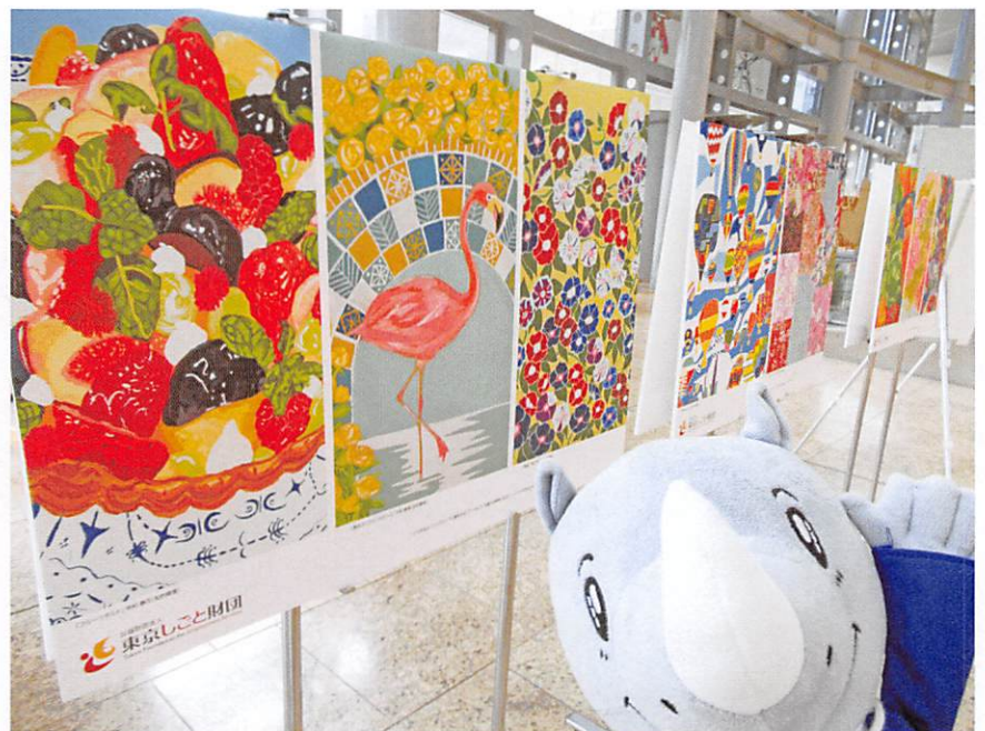
「障害者アート展」の開催風景です。