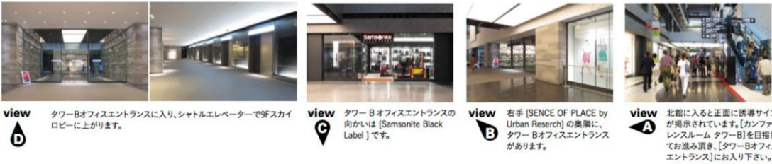
view D タワーBオフィスエントランスに入り、シャトルエレベーターで9Fスカイロビーに上がります。