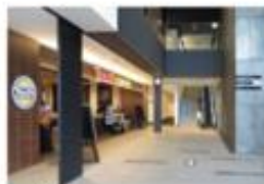
view B [TULLY'S COFFEE] 右手のカンファレンスルーム専用エスカレーターで10Fへ。