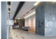
view A 9F スカイロビーでエレベーターを降り左手 [TULLY'S COFFEE] 方向に進みます。