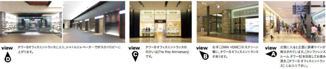
view D タワーBオフィスエントランスに入り、シャトルエレベーターで9Fスカイロビーに上がります。