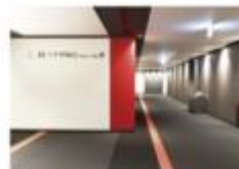
view C 伊からカンファレンスルーム専用エスカレーターで10Fへ。