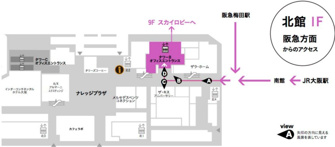
view A 北館に入ると正面に誘導サインが掲示されています。[カンファレンスルーム タワーB] を目指してお進み頂き、[タワーBオフィスエントランス]にお入り下さい。