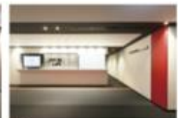
view D カンファレンスルーム専用エスカレーターを上ると左手に受付があります。