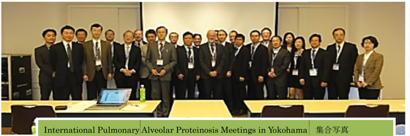
International Pulmonary Alveolar Proteinosis Meetings in Yokohama 集合写真